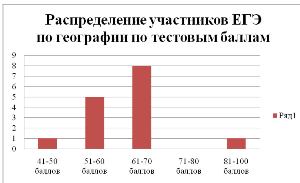
Диаграмма распределения участников ЕГЭ по географии по тестовым баллам в 2020 г. (с ВПЛ)

Диаграмма распределения участников ЕГЭ по географии по тестовым баллам в 2020 г. (без ВПЛ)