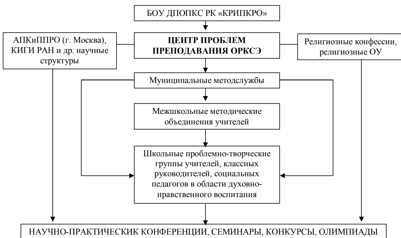
СХЕМА МНОГОУРОВНЕВОЙ МОДЕЛИ ПОВЫШЕНИЯ КВАЛИФИКАЦИИ УЧИТЕЛЕЙ по проблемам духовно-нравственного развития и воспитания учащихся

Таким образом, Центр является системообразующим фактором научно-методического сопровождения деятельности учителей в области духовно-нравственного развития личности учащихся.